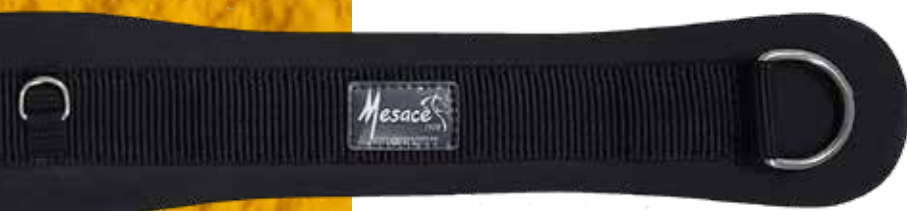
Ref: 730564 Cincha de neopreno