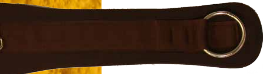
Ref: 730214 Cincha liviana