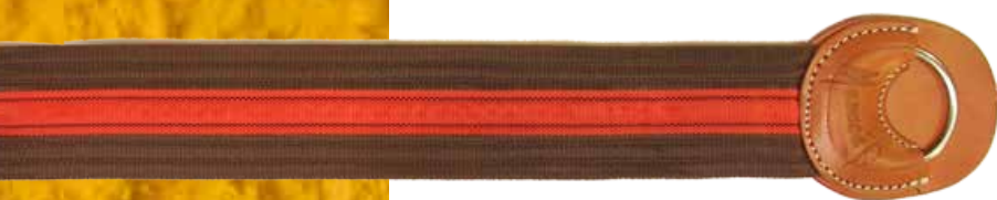
Ref: 730205 Cincha de reata sin chapeta