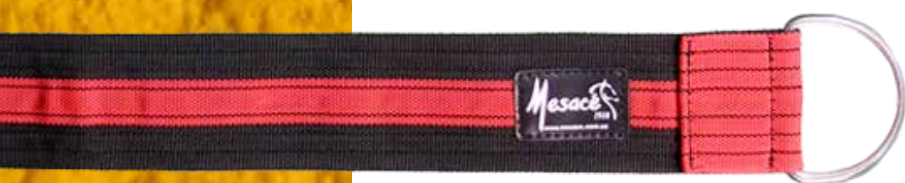
Ref: 730212 Cincha de reata con chapeta